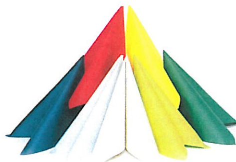
Table Top: vom Gasthof bis zum Fünf-Sterne-Hotel

Die Hunkeler Gastro AG bietet ein ausgewähltes Sortiment an Papierwaren und Textilien für den gedeckten Tisch, ab Lager lieferbar. Beispielsweise die Servietten DecoSoft (siehe Bild). Die schönen, weichen und stabilen Tip-to-tip-Servietten gibt es in vielen verschiedenen Farben. Sie sind ideal zum kreativen Drapieren. Mit DecoSoft bietet Hunkeler eine erheblich günstigere Alternative zur Airlaid-Serviette. Über Servietten mit Werbedruck bis zu Spitzenpapieren aus eigener Produktion und den Fleck-weg-Tischtüchern bietet Hunkeler im Bereich Papierwaren und Textilien mehr als hinlänglich erwartet wird.