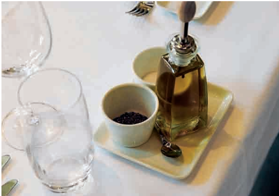
Schöner als die klassische Menage: Salz, Gewürze und Olivenöl attraktiv präsentiert.

Gibt es Verkaufsschlager, die anscheinend nie aus der Mode kommen?