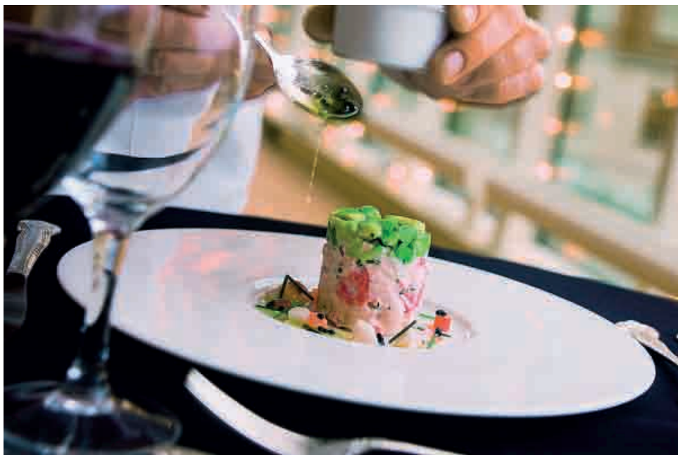
Dekorative Teller bringen die Speisen optimal zur Geltung.

Bruno Hunkeler: «In den letzten Jahren hat Hunkeler Gastro AG im Bereich Table Top mit der Porzellanmarke RAK wie auch mit der Eigenmarke Premio im Besteckbereich sehr erfolgreich gearbeitet. Neu können wir jetzt mit den Porzellanmarken Figgjo und Steelite sowie mit der Besteckmarke Broggi im Bereich Table Top noch mehr bieten. Die drei Porzellanmarken Figgjo, RAK und Steelite bieten eine 5-Jahres-Kantenbruchgarantie für ihre Produkte an.»