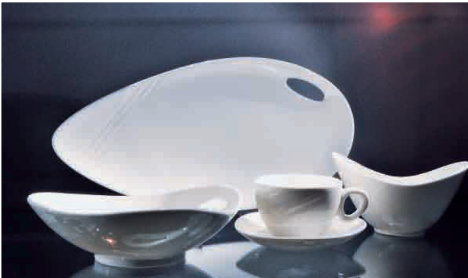
Das Porzellan «Organics» von Steelite International – Europas grösstem Hersteller von Hotelporzellan – umfasst eine Vielzahl von asymmetrischen und organischen Schüsseln, Tellern und Platten.

reich die Anbieterkompetenz weiter verstärken. Die drei Namen werden weiterhin als eigenständige Marken auftreten.»