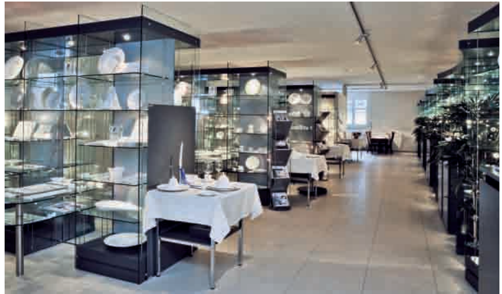
Einer der schönsten Showrooms der Branche.