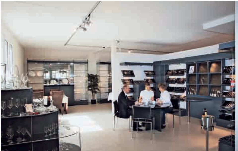
Schönes auf über 500 m 2 im Showroom in Luzern.