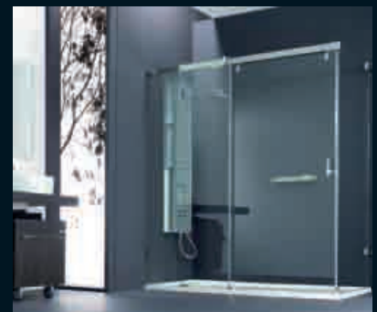
HÜPPE Manufaktur Vista