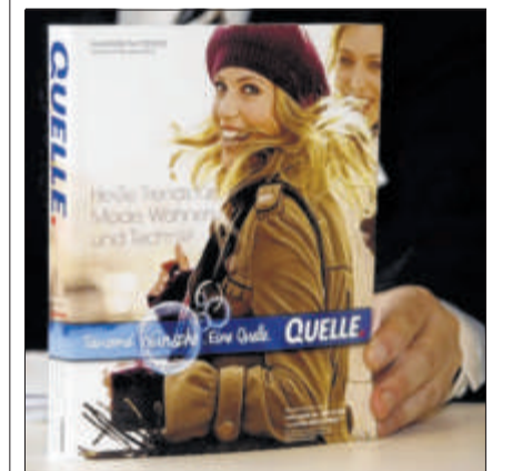
Für den Druck des Katalogs fehlt Quelle derzeit das Geld.

Das Team von Schulz stellt unterdessen die Weichen für eine massiven Umbau des Konzerns. «Es wird drastische Massnahmen geben müssen, die auch Arbeitsplätze kosten werden», sagte der im Görg-Team für die Versandsparte Primondo und damit auch für Quelle zuständige Insolvenzverwalter Jörg Nerlich der «Süddeutschen Zeitung». Wie viele der fast 10 000 Arbeitsplätze wegfallen werden, könne man noch nicht beziffern.